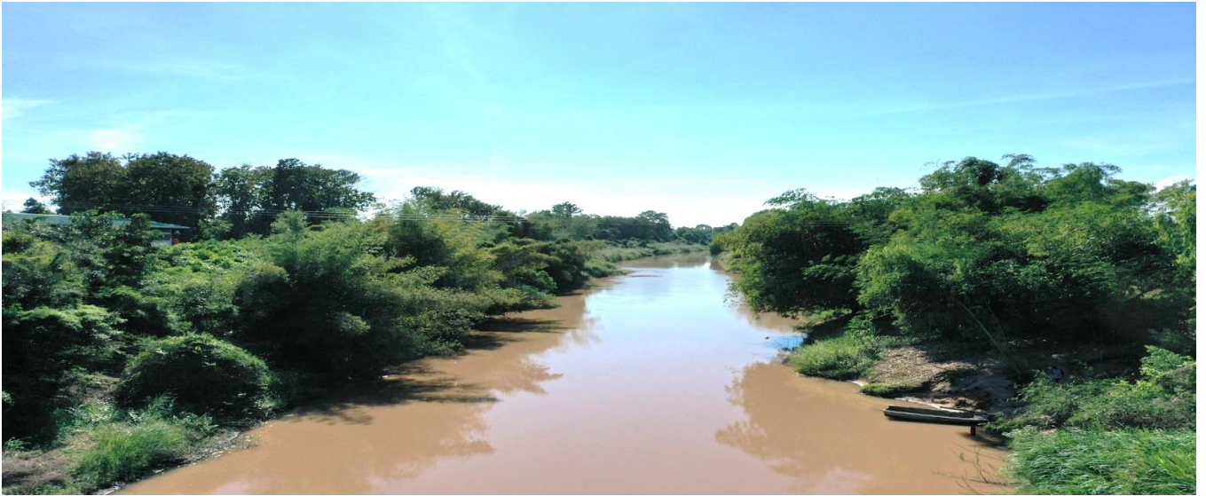
รูปตัดขวางลำน้ำ ปีน้ำ 2567 สถานี N.22 แม่น้ำแควน้อย อ.วัดโบสถ์ จ.พิษณุโลก